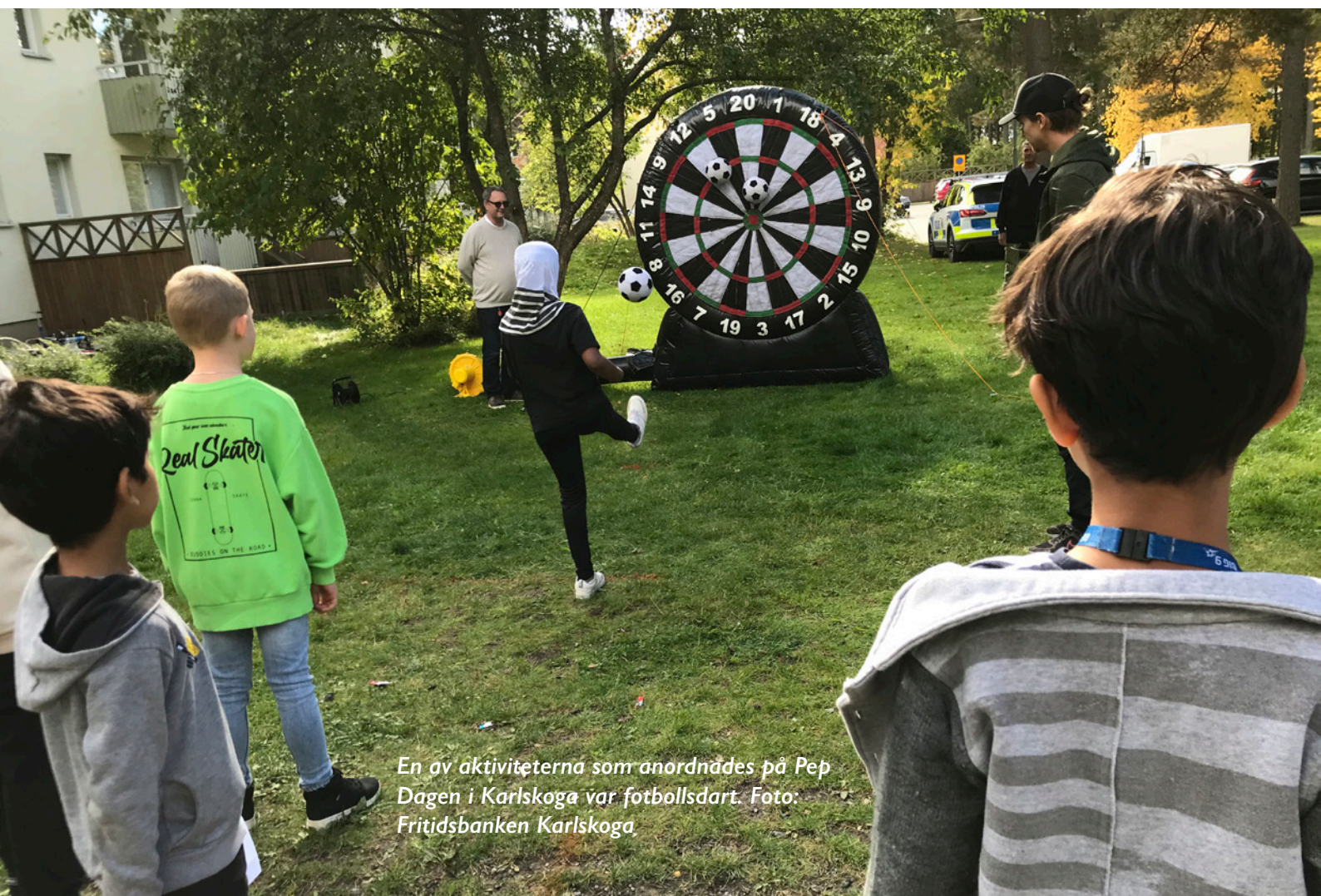
En av aktiviteterna som anordnades på Pep Dagen i Karlskoga var fotbollsdart.

Resultatet blev en gemensam dag där fritidsbankerna erbjöds att arrangera en egen Pep Dag 18 september. Totalt medverkade 24 fritidsbanker och besökarna fick prova på allt från utomhusbowling och sparkcykelbana till bågskytte och hinderbanor. I Hagaparken var Fritidsbanken Sverige på plats med kähphästbana och parasportaktiviteter i samarbete med Svenska Triathlonförbundet. Sammanlagt lockade Pep Dagen 15 000 besökare, varav 10 000 i Hagaparken.