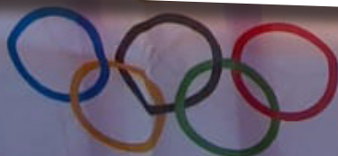
Olympiafestivalen på Spånga IP.